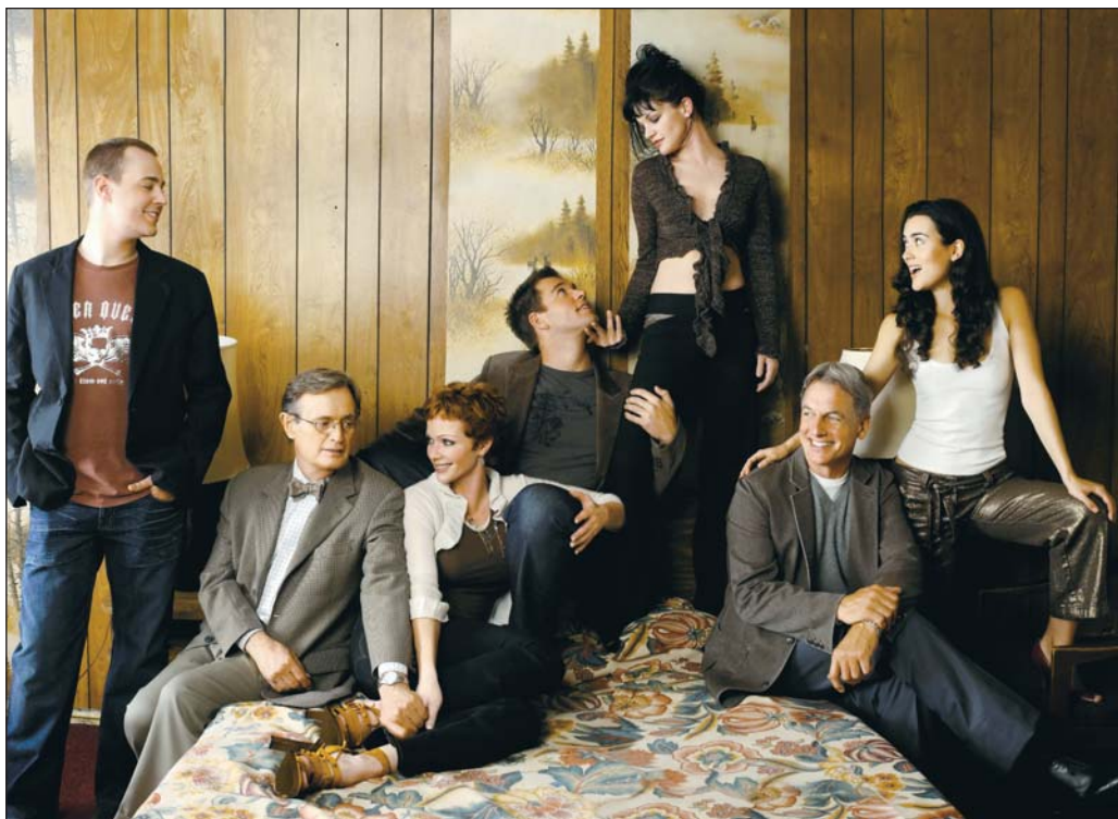
Los singulares personajes forman el grupo de investigación perfecto.

La serie está basada en las investigaciones de la agencia gubernamental de Estados Unidos, que se encarga de los crímenes en los que se